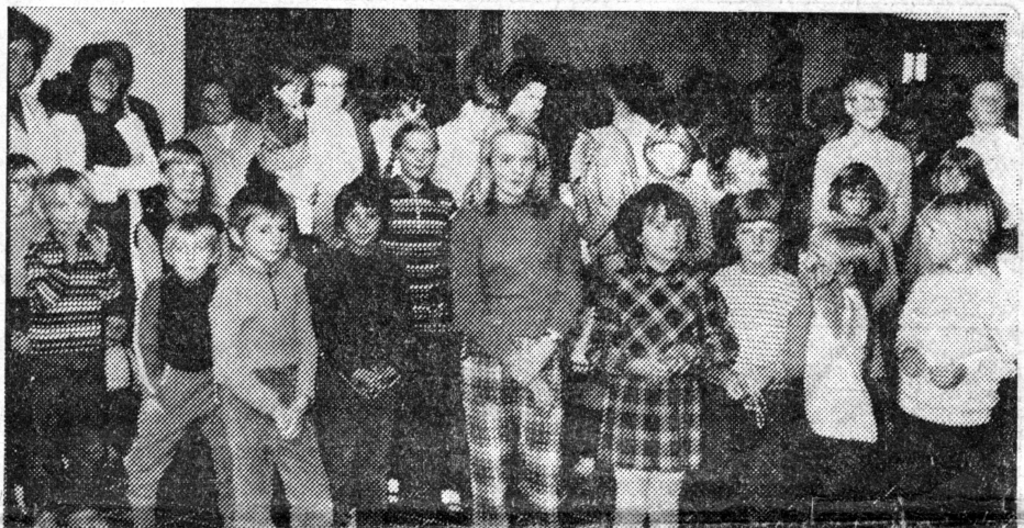
Große und kleine Gäste wohnten der Feierstunde bei.