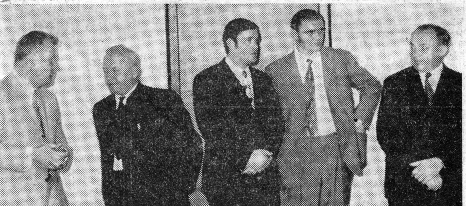
Ein Blick auf einen Teil der Ehrengäste.