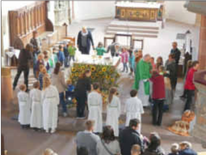
Der Kindergarten Arche Noah gestaltete am Erntedankfest den Gottesdienst mit.