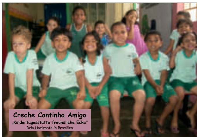
Creche Cantinho Amigo „Kindertagesstätte freundliche Ecke“ Belo Horizonte in Brasilien

Die gute Tat: Sieben Konfirmanden und Konfirmandinnen der evangelischen Kirchengemeinde Ebern haben sich bereit erklärt, ihre Arbeitskraft zur Verfügung zu stellen. Sie helfen z. B. beim Laubrechen, beim Heckenschneiden, beim Gartenumgraben, beim Gehsteigkehren, beim Fensterputzen, Staubsaugen oder auch beim Einkaufen. Gehbehinderte könnten sie auch bei Spaziergängen begleiten. Die Jugendlichen tun diese Arbeit im Rahmen ihres Konfi-Praktikums gegen eine Spende zugunsten brasilianischer Kinder aus der „Creche Cantinho Amigo“.